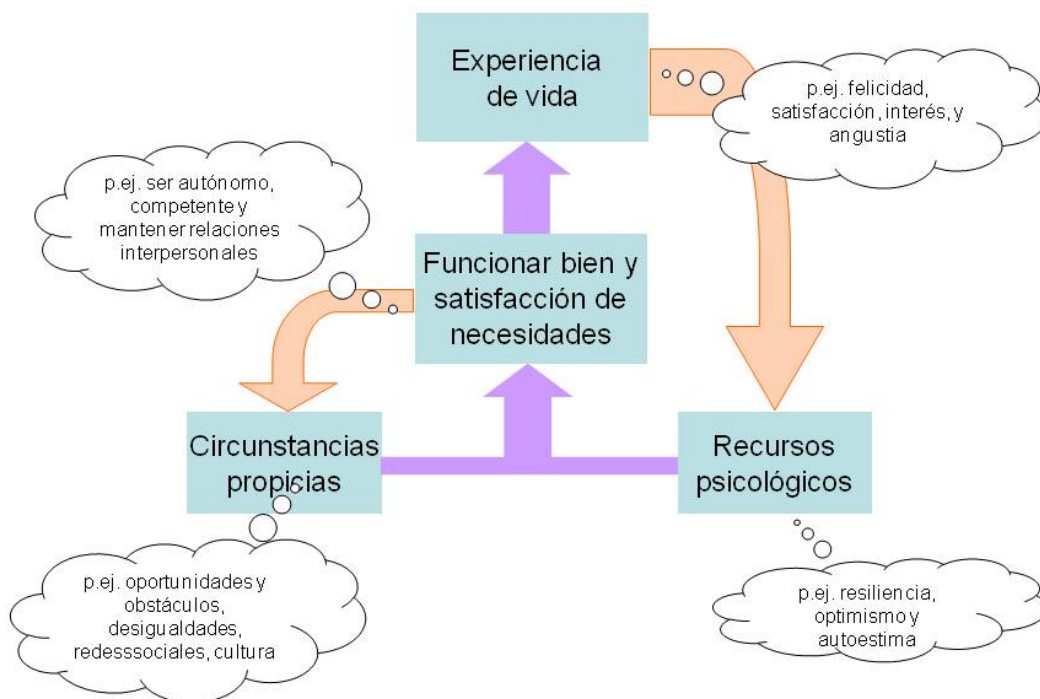
Figura 2: Modelo dinámico de bienestar

En New Economics Foundation (nef) entendemos el bienestar como una síntesis de todas estas lecturas. En su forma más básica, se trata de “sentirse y encontrarse bien.” 30 En un informe preparado recientemente para la Foresight Commission on Mental Capital and Well-being del Reino Unido, explicamos nuestra visión con un modelo dinámico del bienestar (ver Figura 2). 31